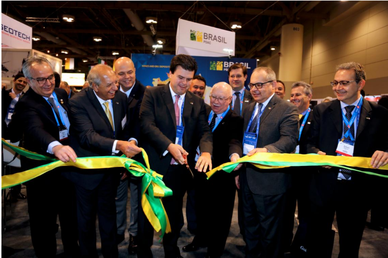
Inauguração do Brasil Pavilion 2017 pelo ministro de Minas e Energia, Fernando Coelho